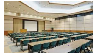
10:30～セミナー配信会場