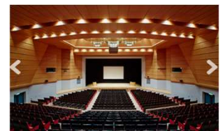
14:30～セミナー配信会場