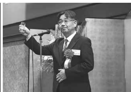
桐谷信宏花巻税務署長による乾杯