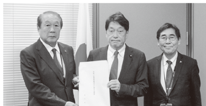
左から飯野税制委員長、小野寺税制調査会長、田中専務理事