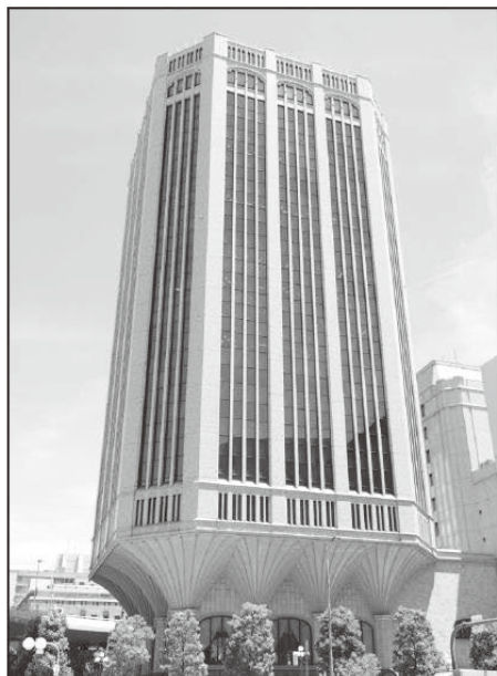
大同生命大阪本社ビル(大阪市西区江戸堀) ～加島屋が店を構えた地に建つ～

ご希望の方は同封の申込書にて FAX 又 は事務局(0198-22-6324)までお問合せ 下さい。