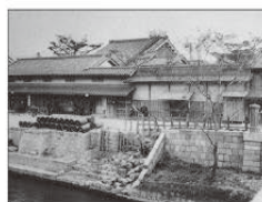
大同生命の礎を築いた 大坂の豪商“加島屋”