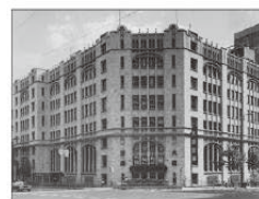
旧肥後橋本社ビル (設計:W・M・ヴォーリス)