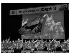
「よさこい鳴子踊り」