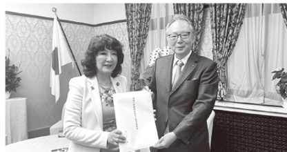
左から片山財務大臣、池田筆頭副会長