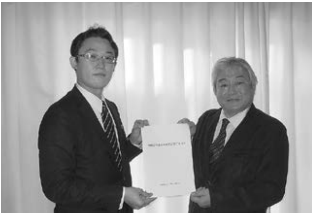
館税制委員長より藤原崇衆議院議員へ

提言は、1「税・財政改革のあり方」2「中小企業が事業継続するための税制措置」3「地方のあり方」について多岐にわたる内容となっています。詳しくは全法連のホームページをご覧ください。