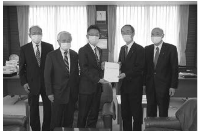
宮澤会長より小原花巻市議会議長へ