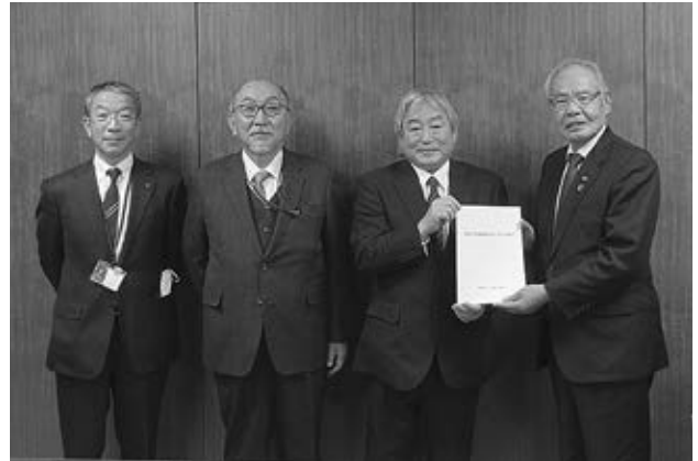
館税制委員長より八重樫北上市議会議長へ