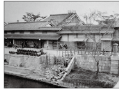
大同生命の礎を築いた 大坂の豪商“加島屋”