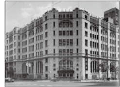
旧肥後橋本社ビル (設計:W・M・ヴォーリス)